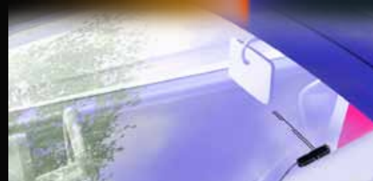
フィルムレス ダイカットアンテナ (左右1組み付属)