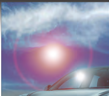
暑さに強く車内でも安心

さまざまなシーンで大活躍！ バッテリーレスでコンパクト色々な機器を簡単接続できる。