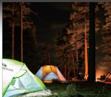
コンパクトで持ち運びに便利